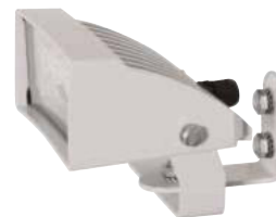
GEKO IRH WEISSES LICHT